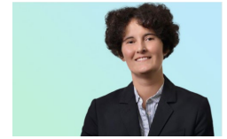
エロディー・デュラック (パートナー) フランスおよびカンボジア* 投資協定