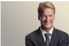
ザック・ファードン シカゴ