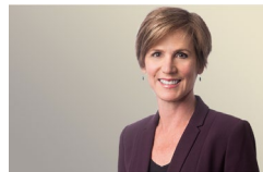
サリー・イエーツ アトランタ