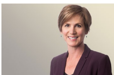
Sally Yates Atlanta