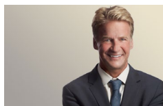
Zach Fardon Chicago