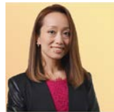
シャオマオ・ミン 中国 マンダリン