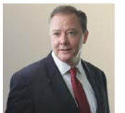
エド・キーホー ニューヨーク