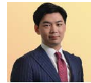
デイビッド・パーク オーストラリア 韓国語