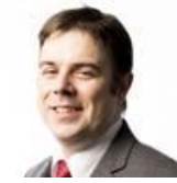
オリバー・マッケンティー 英国法廷弁護士 日本語